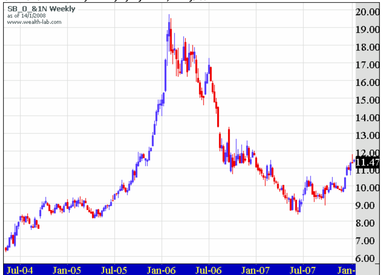
Graf č. 1: Dlouhodobý cenový vývoj cukru

Komoditní trhy v současnosti přezívají renesanci. Poskytují vyšší zhodnocení než dluhopisy i potápějící se akciové trhy. Zatímco v minulém roce stačilo nakoupit téměř jakoukoliv komoditu, v tomto roce musejí být investoři více vybíraví. Jedním z našich favoritů pro nadcházející období je cukr. Cena cukru za poslední 2 roky prudce propadla. V lednu 2006 se ještě pohybovala těsně pod hodnotou 20 centů za váhovou libru. Momentálně se aktivní kontrakt obchoduje přibližně za 11,50 centů/libru. To je velmi odlišný cenový vývoj oproti jiným komoditám, které se používají na výrobu biopaliv. Stačí se podívat kupříkladu na kukuřici nebo řepku. Obě zhodnotily o desítky procent. Taktéž ropa se v současnosti pohrává s myšlenkou překonat magickou 100 dolarovou hranici. Podle naší fundamentální analýzy je cukr relativně podhodnocen, proto očekáváme, že jeho cena začne výrazně stoupat. Technickou analýzu jsme použili pro potvrzení signálu. Budeme nakupovat futures kontrakt na cukr za cenu na trhu. V časovém horizontu 3 až 6 měsíců predikujeme zhodnocení na 13 centů/libru.